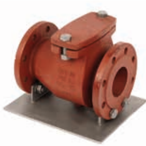
Rückschlagklappe Typ GW-RSK-080G