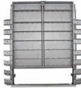
Rinnenschieber Typ GW-4R