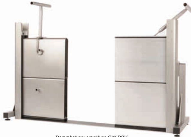
Dammbalkenverschluss GW-DBV ausgeführt in Edelstahl und Aluminium