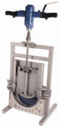
Gewindeschieber Typ GW-SDNR und Motorschieberschlüssel Typ MSS