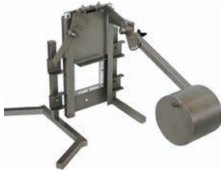
Schwimmer-Drossel-Schieber Typ GW-SDS