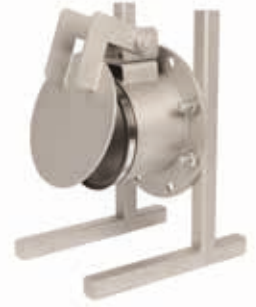
Rückstauklappe zum Anflanschen Typ GW-RED